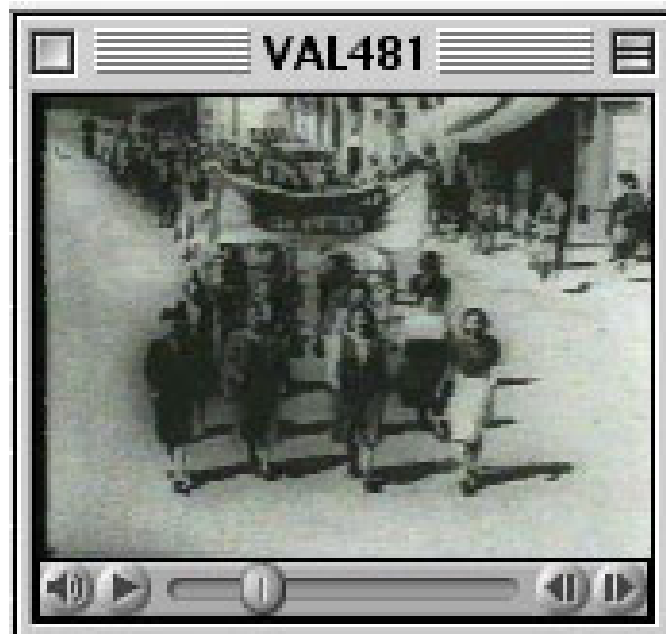
Ur kommunisternas valfilm 1948. Se: www.arbarkiv.nu/utställning_04_21.htm

Morgonbris extraupplaga. Den nya familjen - det nya samhället, 1935